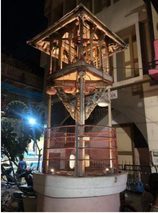
8/9ઢાઁની ડોઁ ડેસ્ટિવલ: